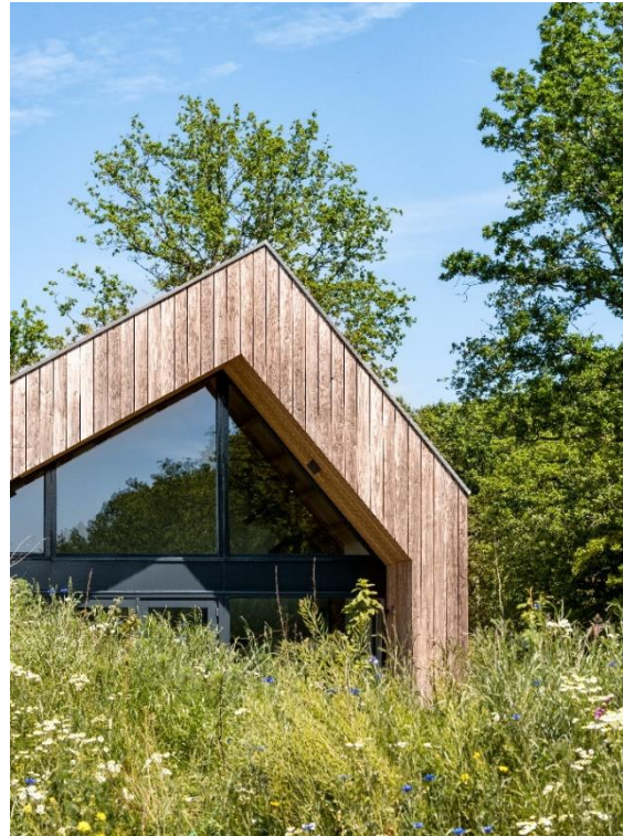
Inheemse beplanting neemt gebouwen over

De paviljoens bestaan uit zoveel mogelijk lokale hernieuwbare natuurlijke (biobased) materialen. Het lariks hout heeft een hoge levensduur en een lage impact op de natuurlijke kringloop. De gehele houtconstructie, houten balken, beplating, kozijnen en gevelmaterialen zijn demontabel. De constructie is opgebouwd door middel van droge verbindingen en heeft daarmee een hoge mate van losmaakbaarheid. De natuurplaats gaat verder dan circulariteit en is tevens een klimaat-adaptieve ontwikkeling. Het substraat op het dak houdt het regenwater vast. Het regenwater wordt zichtbaar over het oppervlakte afgevoerd. Er worden meerdere WADI's gerealiseerd in de vorm van kleine "beekdalletjes" welke bij heftige regenval zichtbaar worden. Door een substraatlaag van 15cm kunnen lokale planten en grassen ook op de gebouwen groeien. Het gebouw is hiermee natuurinclusief.