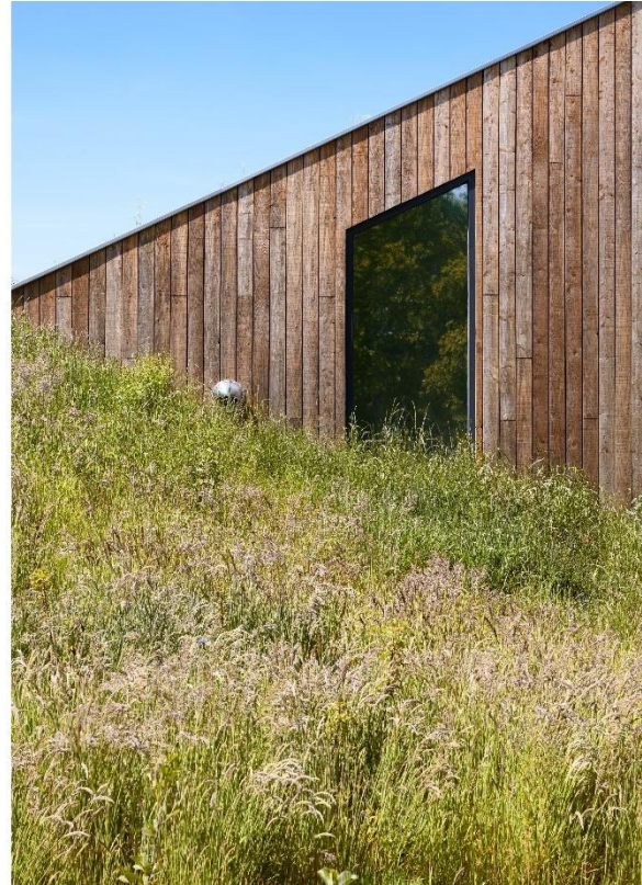
Sober en doelmatige detaillering