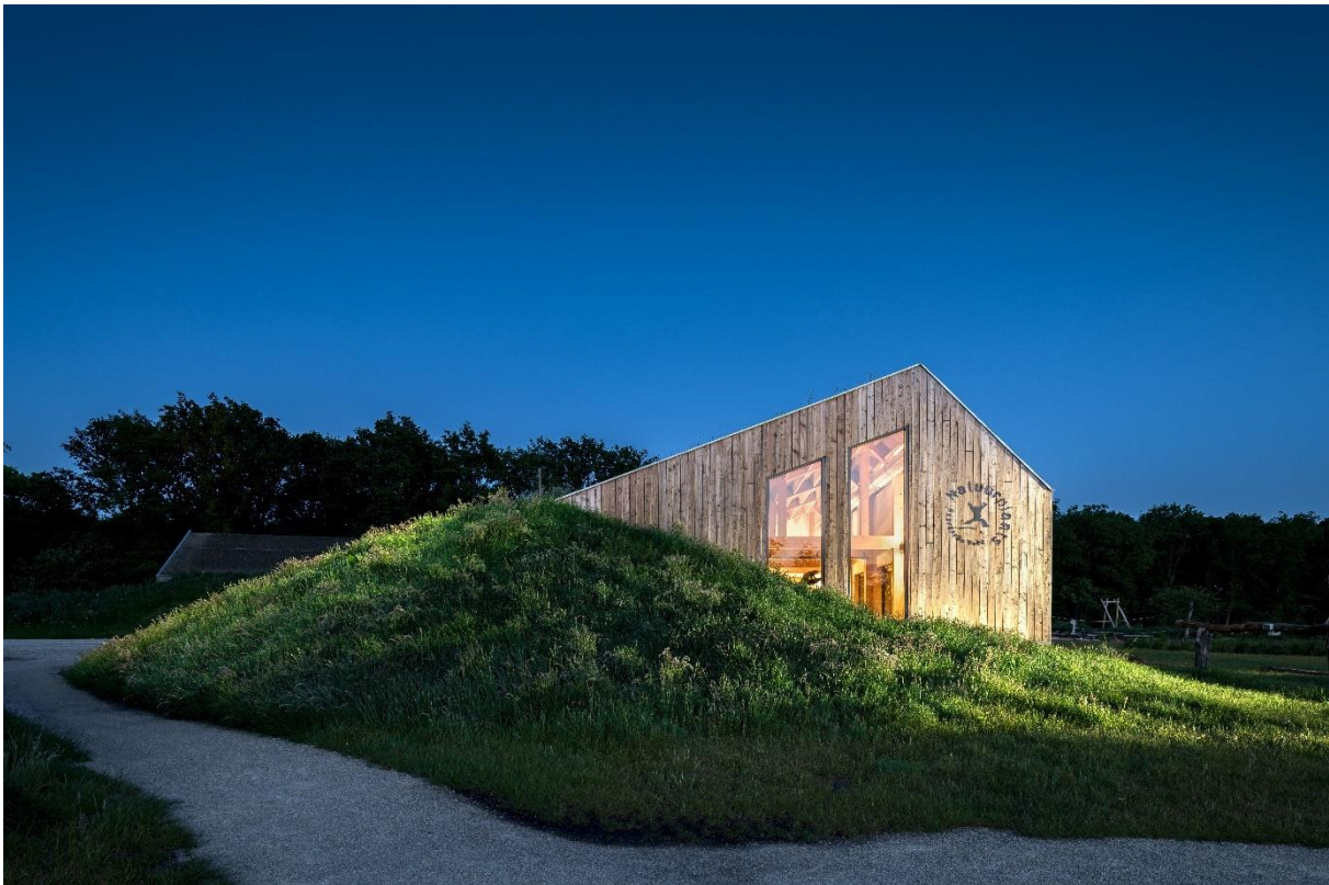
Gebouw en landschap lopen in elkaar over